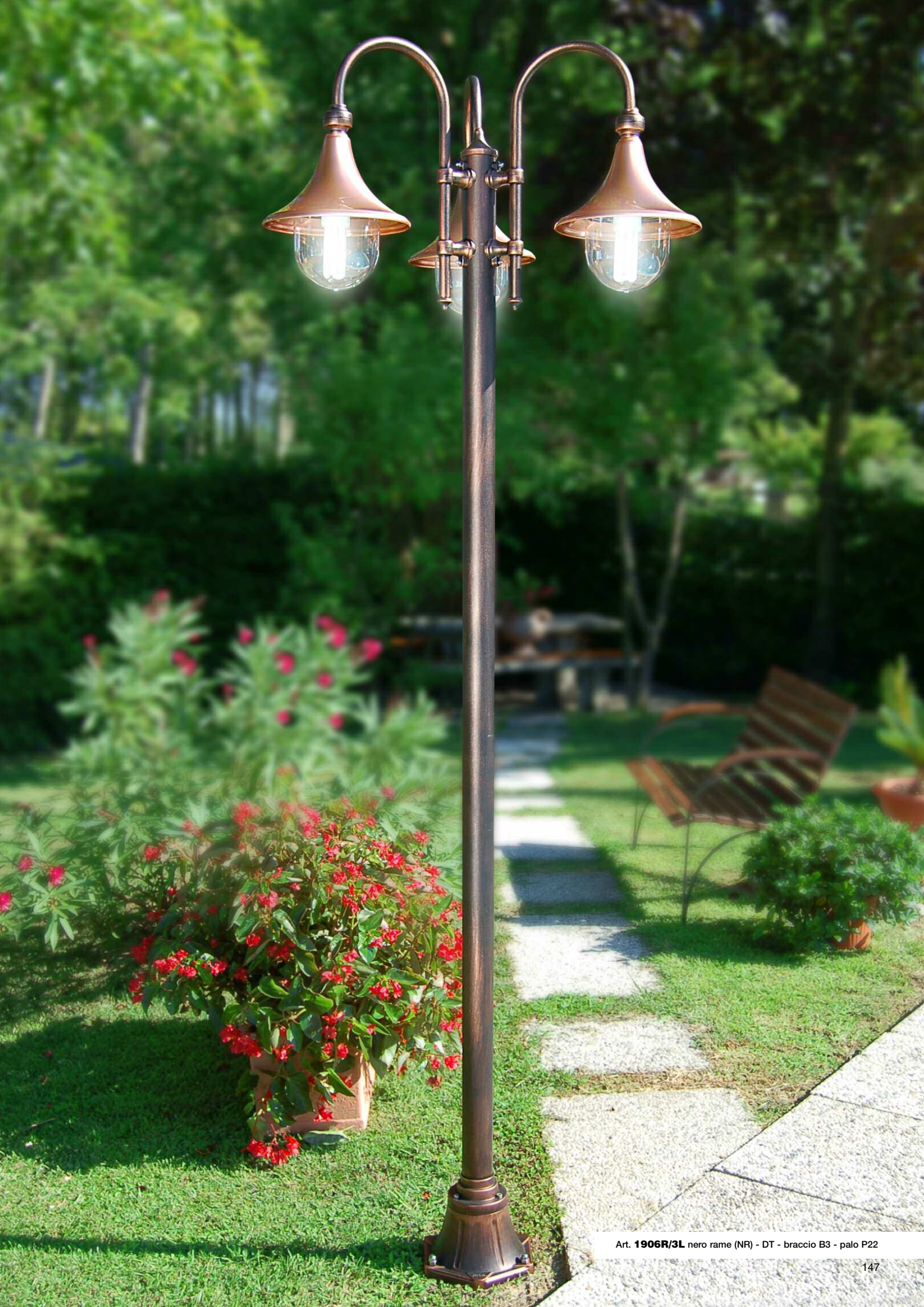
Art. 1906R/3L nero rame (NR) - DT - braccio B3 - palo P22