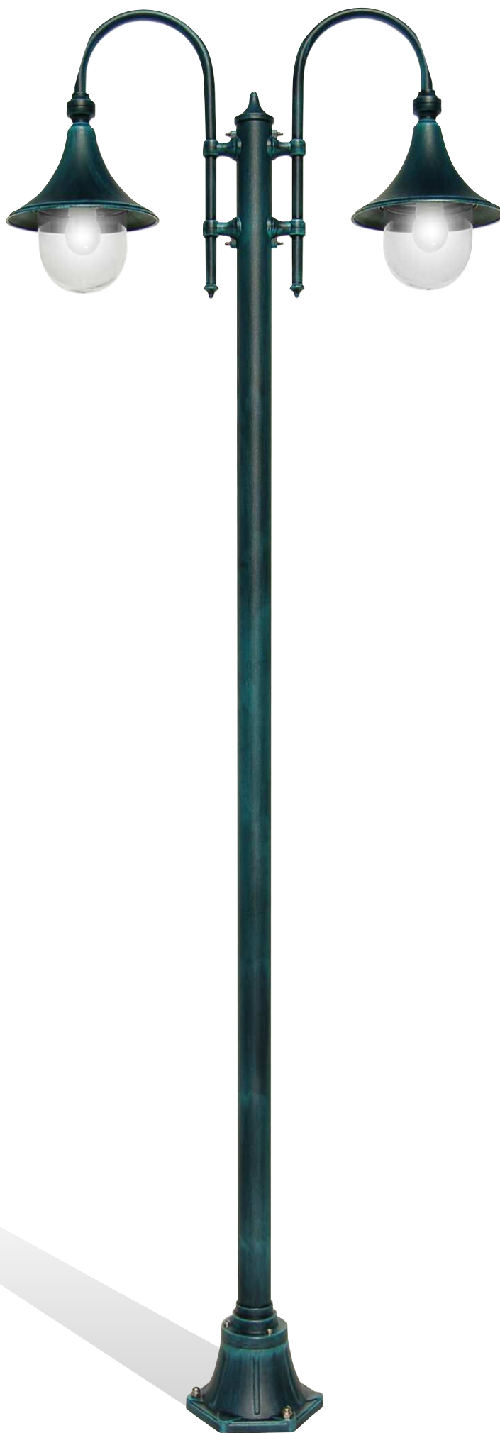
Art. 1906A/2L nero verde (NV) - DT - braccio B3 - palo P22 h 1880 mm - ø 820 mm