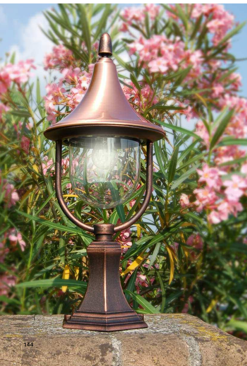
Art. 1900R nero rame (NR) - DT