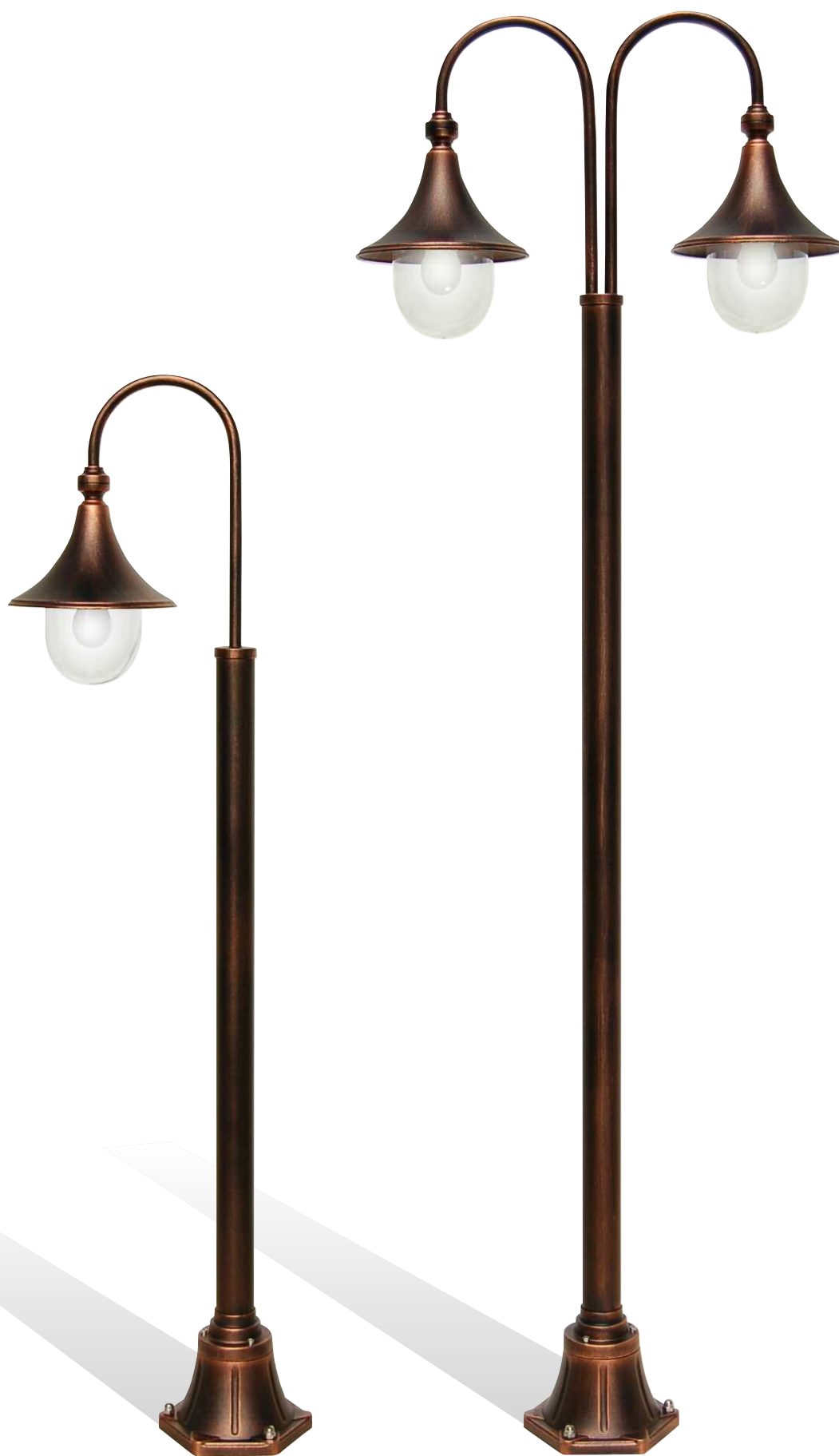
Art. 1909A/1L nero rame (NR) - DT - braccio B3F - palo P20 h 1620 mm - ø 460 mm