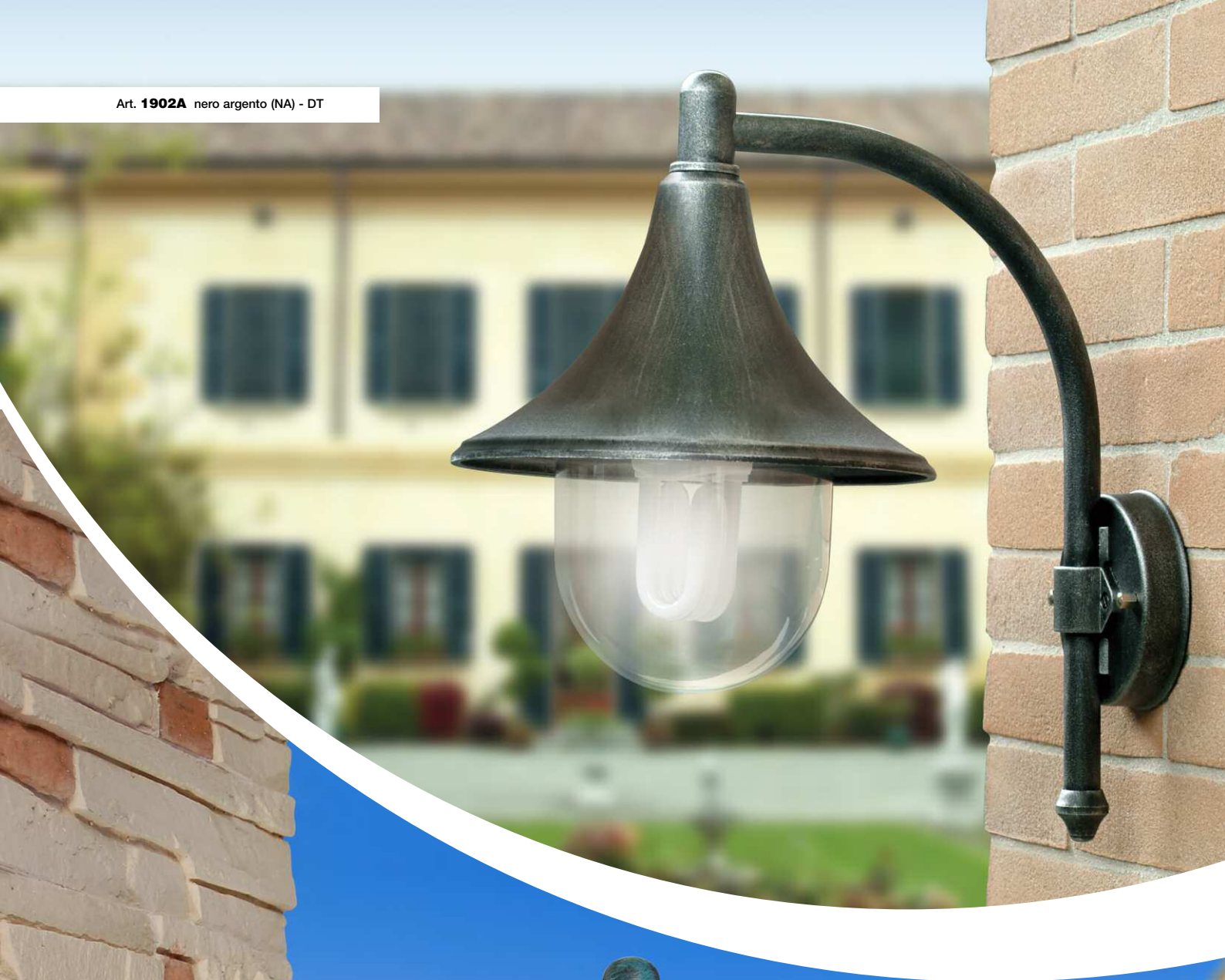
Art. 1902A nero argento (NA) - DT