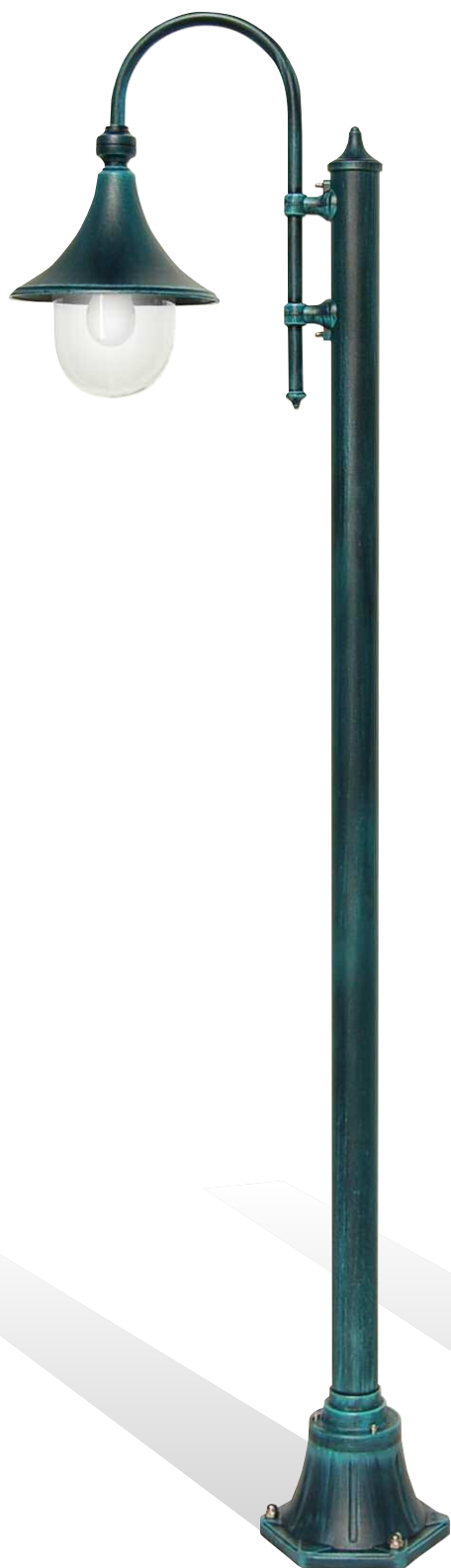
Art. 1905A/1L nero verde (NV) - DT - braccio B3 - palo P21 h 1380 mm - ø 530 mm