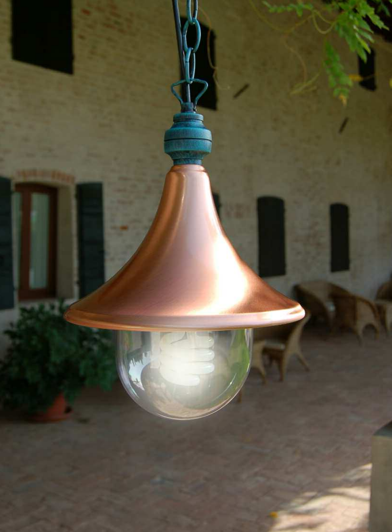
Art. 1903R nero verde (NV) - DT