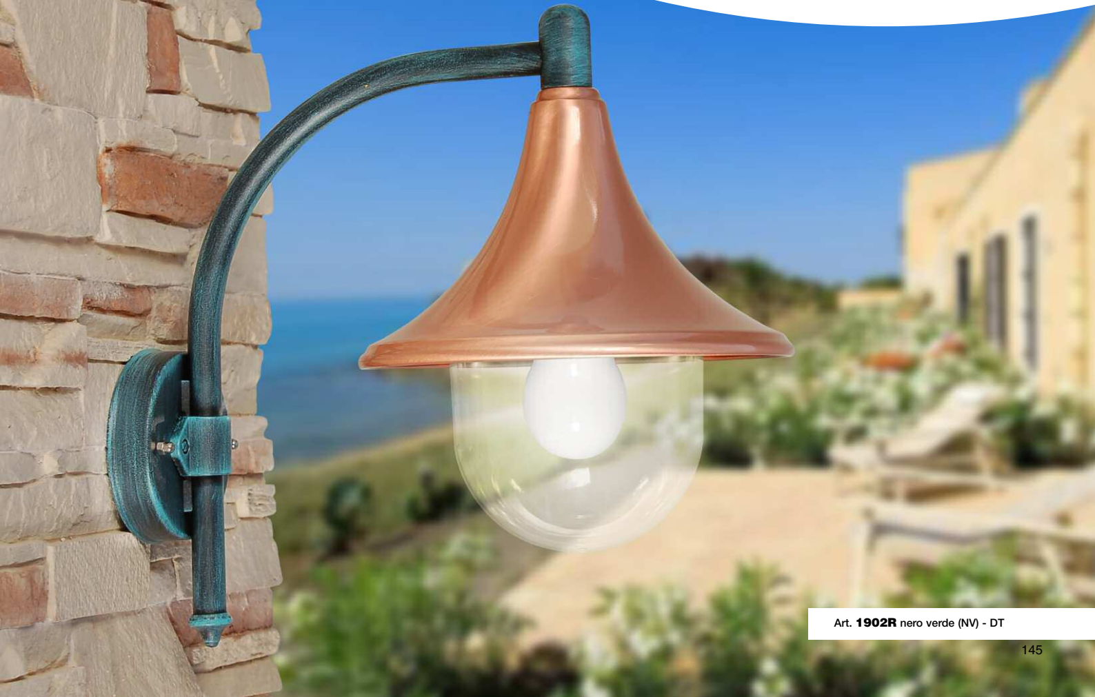
Art. 1902R nero verde (NV) - DT