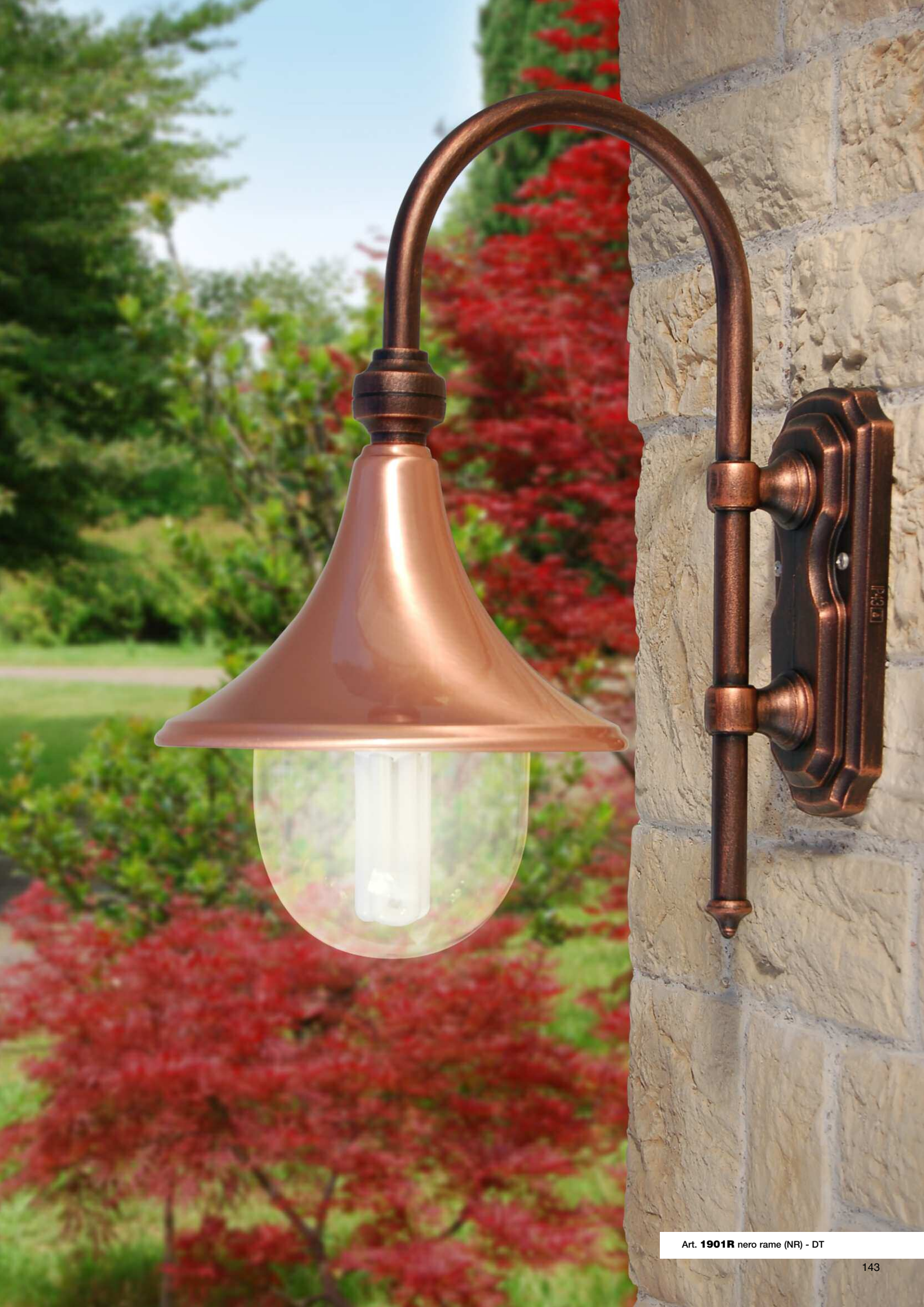
Art. 1901R nero rame (NR) - DT