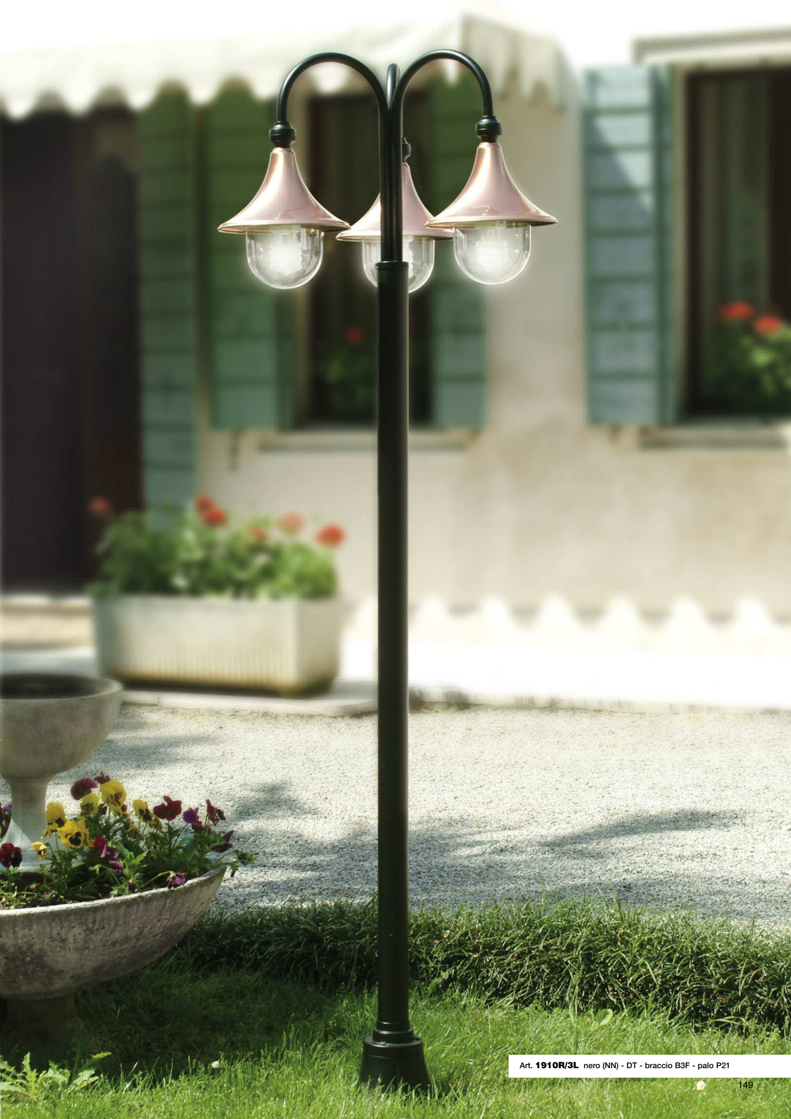
Art. 1910R/3L nero (NN) - DT - braccio B3F - palo P21