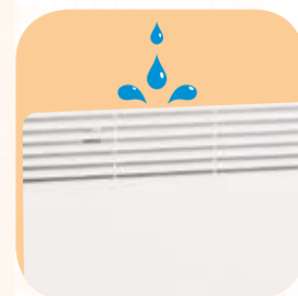
Protezione contro gli spruzzi d'acqua