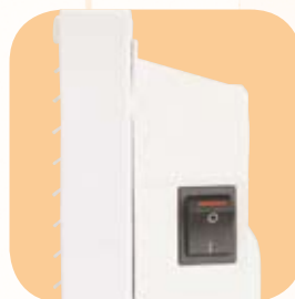
Interruttore spento/acceso laterale