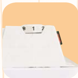
Termostato regolabile di grande precisione situato nella parte posteriore del pannello