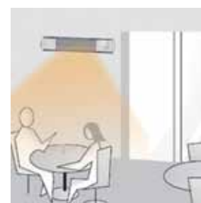
Terrazze di bar, ristoranti.