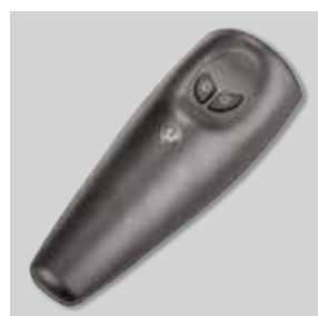
Comando a distanza