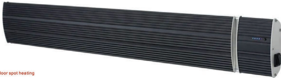
Indoor spot heating