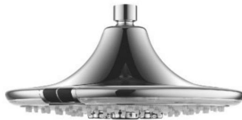
Soffione a pioggia con sensore